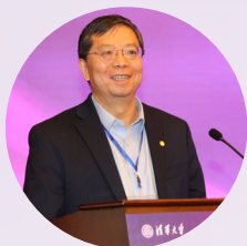
▲ 清华大学校长、校友总会会长邱勇致辞

2019年10月27日，清华大学第二十一一次校友工作会议在青岛举行。来自海内外79个校友会、8个专业委员会和行业协会、5个院系分会的代表，以及校友总会特邀代表、校友总会理事和学校相关部处负责人等近200人参会。