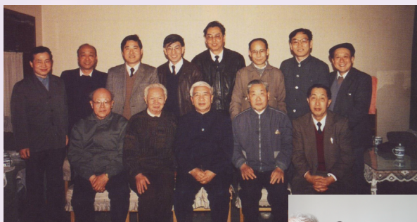
▲ 20世纪90年代初，李恒德先生（前排右2）与工程物理系同事重聚一堂

李恒德（1921.6.30—2019.5.28），中国工程院院士、清华大学材料科学与工程系教授。我国著名材料科学家、教育家，我国核材料和金属离子束表面改性研究的先驱者、生物仿生材料的开拓者。