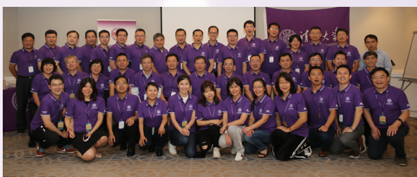
▲ 北美校友工作研讨会与会人员合影