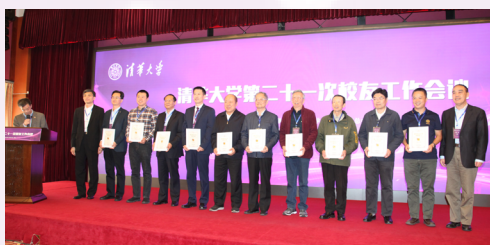
▲ 颁发校友工作荣誉奖章