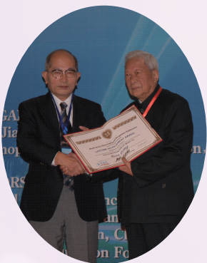
▲ 2010年，第九届亚洲热物性会议授予王补宣（右）终身成就奖

王补宣（1922.2.5—2019.8.31），中国科学院院士、清华大学能源与动力工程系教授。我国著名的热工教育家、工程热物理学科的卓越开拓者。