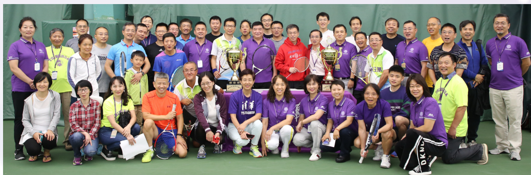
▲ 马约翰杯运动会开幕式