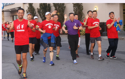
▲ 邱勇校长与校友一起晨跑

2019年9月21日，第三届北美清华校友大会暨首届清华校友“马约翰杯”运动会在多伦多举行，来自北美及其他共44个地区的约750名校友欢聚一堂。大会以“凝聚力量、共谋发展、引领未来”为主旨，与会校友共叙清华情谊，共商未来发展。