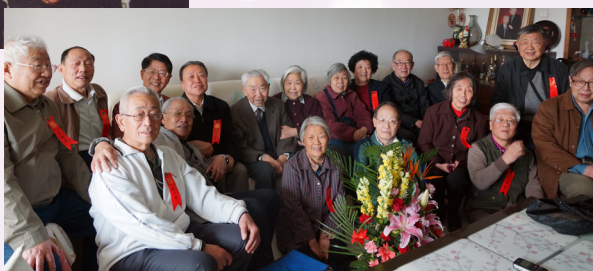
▲ 2012年4月29日，李恒德院士（后左5）与学生合影