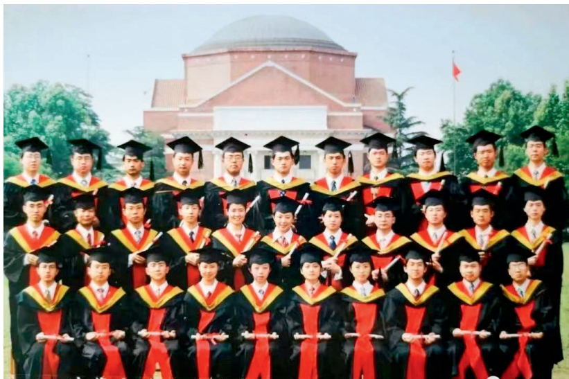
清华大学自动化系自43班毕业留念

鱼和熊掌不能兼得，双学位我是不能放弃的，就只能放弃篮球队了。我本来“先天”就不足，个子又矮又瘦，又没有足够的时间跟大家一起练，比起从小训练的人，很难匹敌。好在一直到大五，我虽然不能去参加比赛，训练也只能是抽空去，但是不管我什么时候想去训练，只要有人在训练，教练都给我开绿灯，我就可以跟她们一起练。我始终觉得，能培