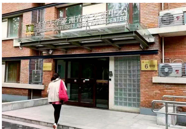
作者毕业20年重回6号楼