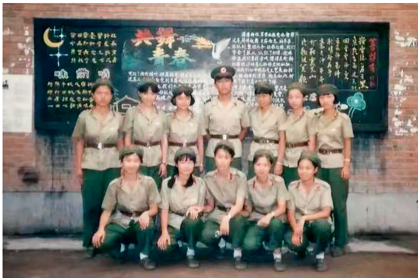
军训时的女生的合影

就这样，只要女篮训练我就去，一直练到高二上完，到高三的时候就不允许再参加篮球队了，我就没有再去。但是每天放学后