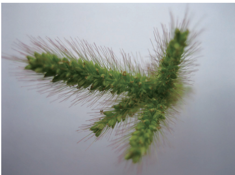
笔者小孙子找到的四头狗尾巴草。

历时跨年，日晒雨淋，小伤无数……摸过千千万万棵草都是失望，最后的结果也可能是失败。寻草是孩子选的题目，通过自己的劳动，他完成这项工作，是孩子自主、独立的实践获得了超出常识的知识。这不是人类获得新知识的常态嘛！成功找到多头