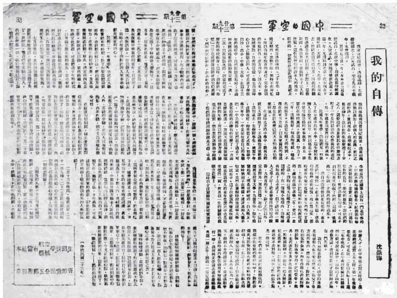
刊载于《中国的空军》上的《我的自传》

过的杨钟健先生商讨，觉得应先打好根基。并设法鼓励内地青年西移，再图进展。所以又规划由近而远的工作计划草案，准备按步实施。