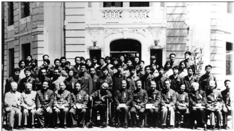
参加校友座谈会合影。第一排左4为蒋南翔，左6、7、8分别是高士其、宋平、荣高棠。后排右1为林炎志、右3为作者。摄于1981年70周年校庆