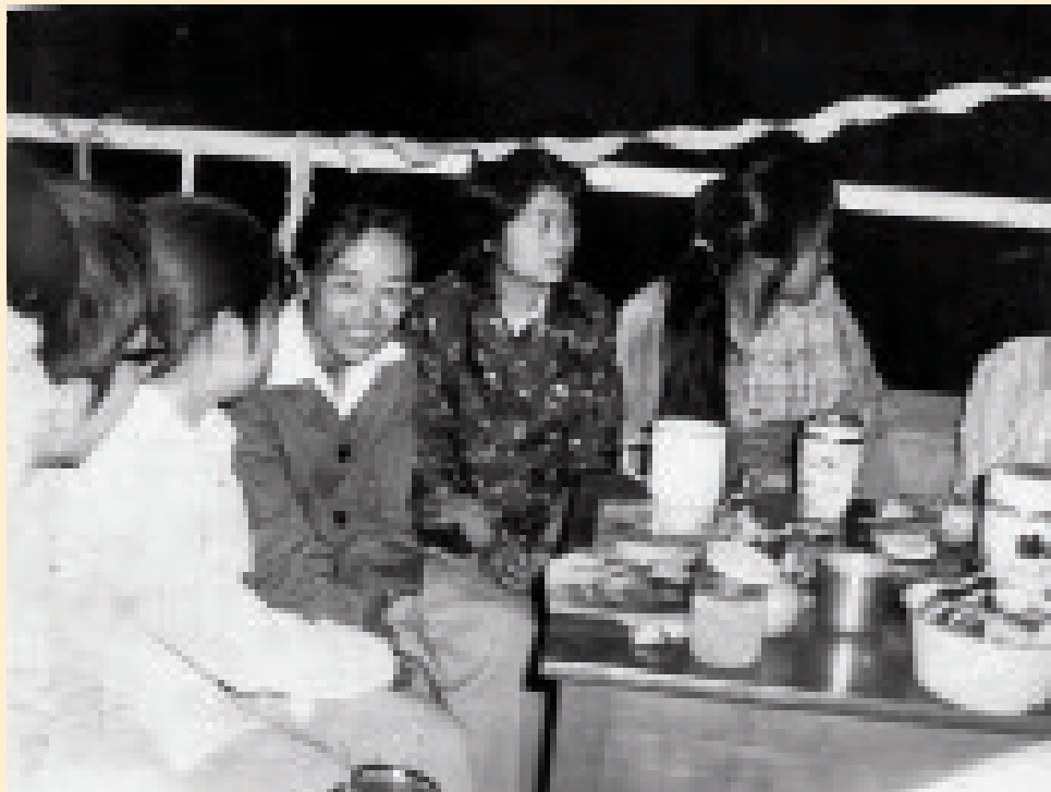
三十余年前在17和18号楼过街天桥上开中秋晚会的照片