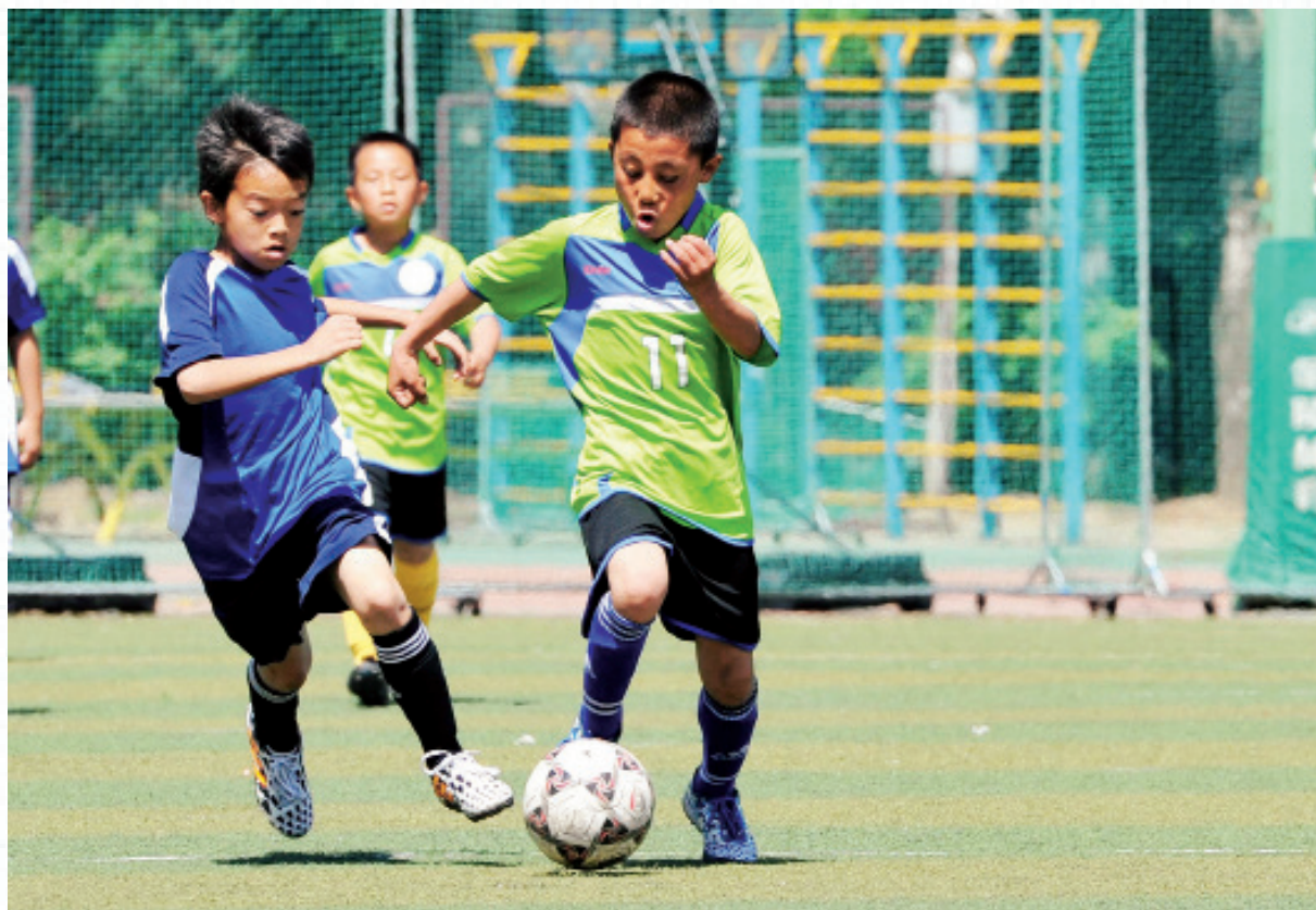
清华附小足球队与由兰州东郊学校等多所小学联合组成的西部少年足球队在北京举行友谊赛

当前，我国体育人口只占总人口的30%左右，与体育发达国家有很大差距。更为严峻的是，我国还是发展中国家，很多地区经济条件比较落后，体育资源比较稀缺，严重阻碍了我国群众体育和学校体育的开展。因此，选择广受关注、