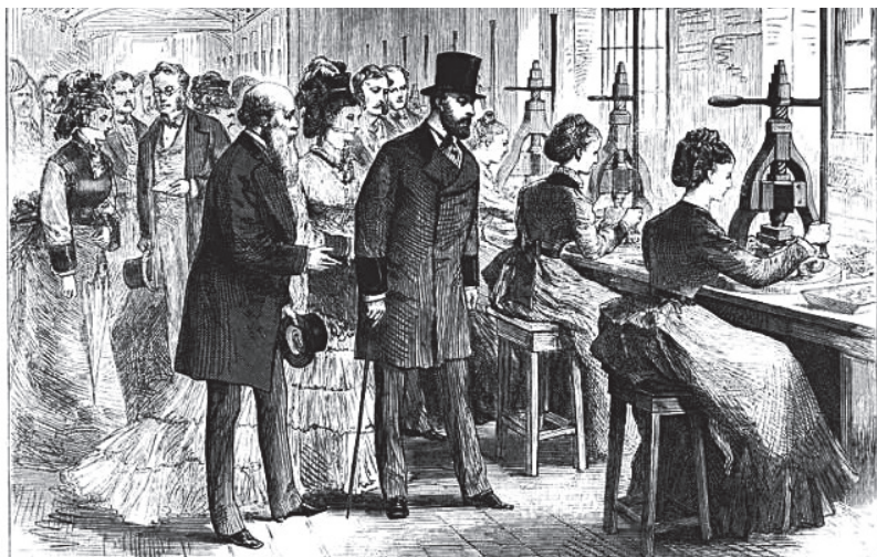
1874 年，爱德华七世参观 gillott 笔尖工厂