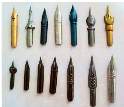
各式各样的点尖， 不同字体需要不同软硬程度的笔尖