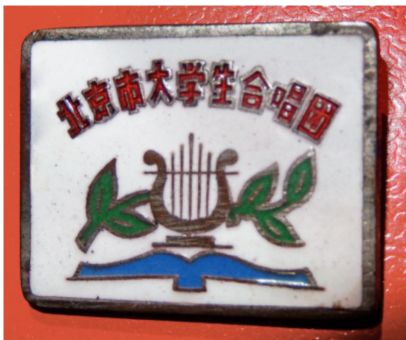
北京市大学生合唱团团徽

我是1955年9月进入清华机械系的。一位电机系的中学学长知道我在中学一直爱唱歌，就建议我去考“北京市大学生合唱团”。那时