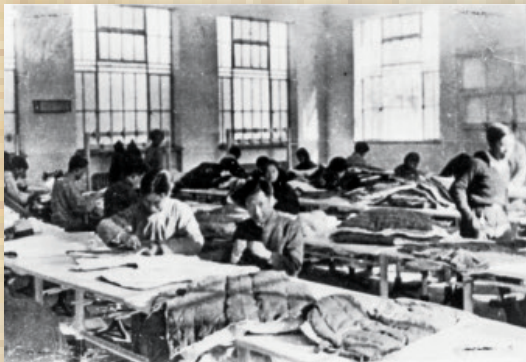
清华教师家属为抗日战士缝制棉衣

1933年1月，日寇将魔爪伸向华北。6日，清华学生会致电国民政府表示“誓与日寇不共戴天”。8日，学生会抗日救国会召开紧急会议，议决成立战时工作准备队。清华师生着手组织义勇军、看护队、救护队、慰劳队。