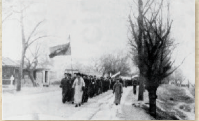
12月16日晨，清华大学学生扛着“反对冀察委员会”条幅冲破重重阻碍，进城参加示威游行。