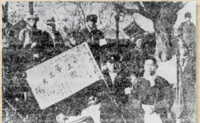
根据中共北平市委指示，北平学联组织平津学生南下扩大宣传团。清华南下宣传团在出发前宣誓：“我们下了最大决心，出发下乡，宣传民众，组织民众，不怕任何障碍，不惜任何牺牲，不达目的，誓不返校。”图为清华、燕京等校学生组成南下扩大宣传第三团在蓝靛厂集合准备出发。