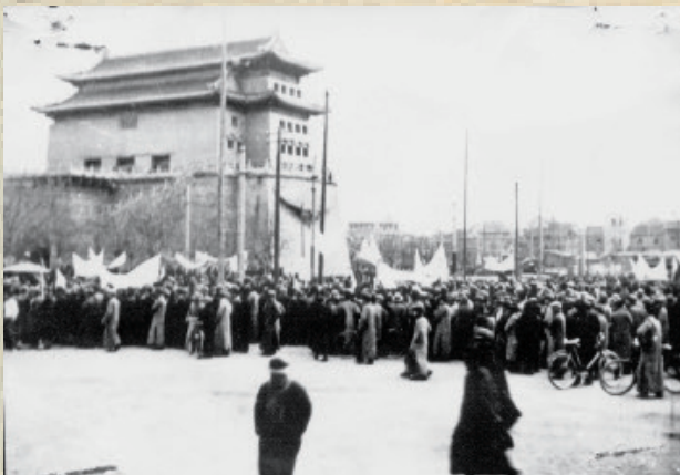
12月16日，示威群众在前门开市民大会，图为清华队伍。