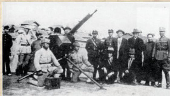
1936年11月，叶企孙(后排站立者右2)、吴有训(后排站立者右3)慰问宋哲元29军。