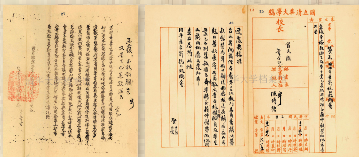
1931年11月，清华师生捐款慰劳齐齐哈尔抗日将士。图为清华大学和北平各界抗日救国会为捐款事的往来信函。