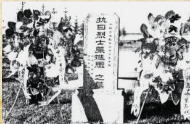
位于黑龙江省富锦市的张甲洲墓

张甲洲（1907~1937），又名张进思，中共党员。1930年考入清华大学政治学系。1932年4月，张甲洲与于天放（清华1932级学生）等奔赴被日军占领的黑龙江省巴彦县，组织抗日游击队，一举收复巴彦县城。游击队后改编为中国工农红军第36军江北独立师，他任师长。1937年8月28日，在转移途中与敌人遭遇，壮烈牺牲，时年30岁。