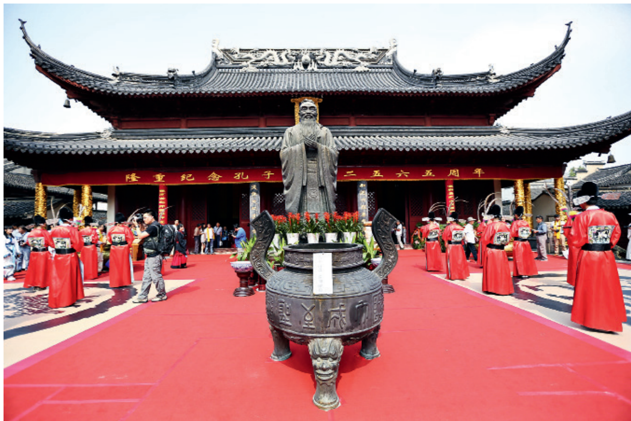
2014年，南京举行祭孔大典

不尊重个人、不关心个人，这也是不对的。如果我们想把传统价值观的传统转化，加以发展，我们要坚持这些“本”、“先”，但是同时我们也要关注那些“被先于”的内容。