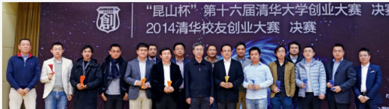
2014 清华校友创业大赛决赛颁奖后合影