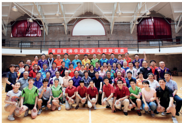
第四届清华校友乒乓球联谊赛参赛校友合影