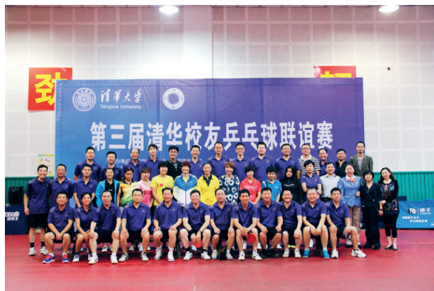
第三届清华校友乒乓球联谊赛参赛校友合影