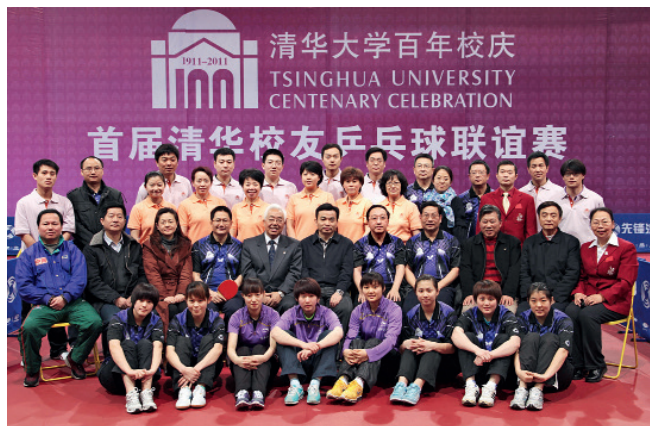
首届清华校友乒乓球联谊赛参赛校友合影

清华校友乒乓球协会现有会员近100人，是清华校友最早成立的兴趣爱好协会。协会成立后，先后和中电联、中国船舶重工集团等中央在京单位举行友谊赛，并每年举办一届校友乒乓球联谊赛，很好地丰富了广大校友的业余生活，促进了校友之间的友谊。