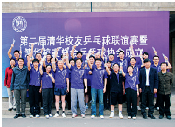
第二届清华校友乒乓球联谊赛参赛校友合影