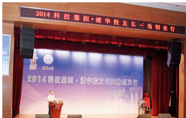
“2014 清华校友长三角创业行”启动仪式现场