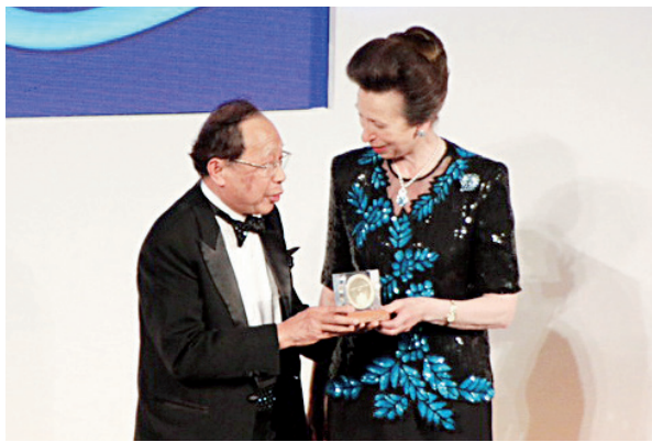
安妮公主为陈清泉院士（左）颁授勋章

陈清泉，电力驱动和电动车专家。福建人。1937年生于印尼。1953年回国就读于北京矿业学院，1957年毕业，同年被保送清华大学电机工程系读研究生。1997年当选为中国工程院院士。陈清泉院士长期致力于电动汽车领域的发展，发表300余篇学术论文。在40多年的职业生涯中共出版11本著作，包括影响深远的《现代电动汽车技术》。