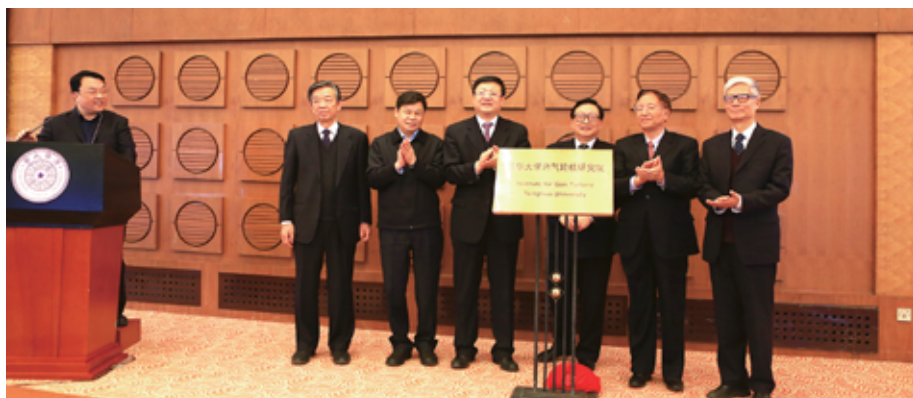
▶ 清华大学燃气轮机研究院成立