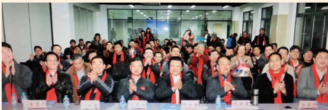
▲ 上海校友会机电专业委员会召开2013年年会