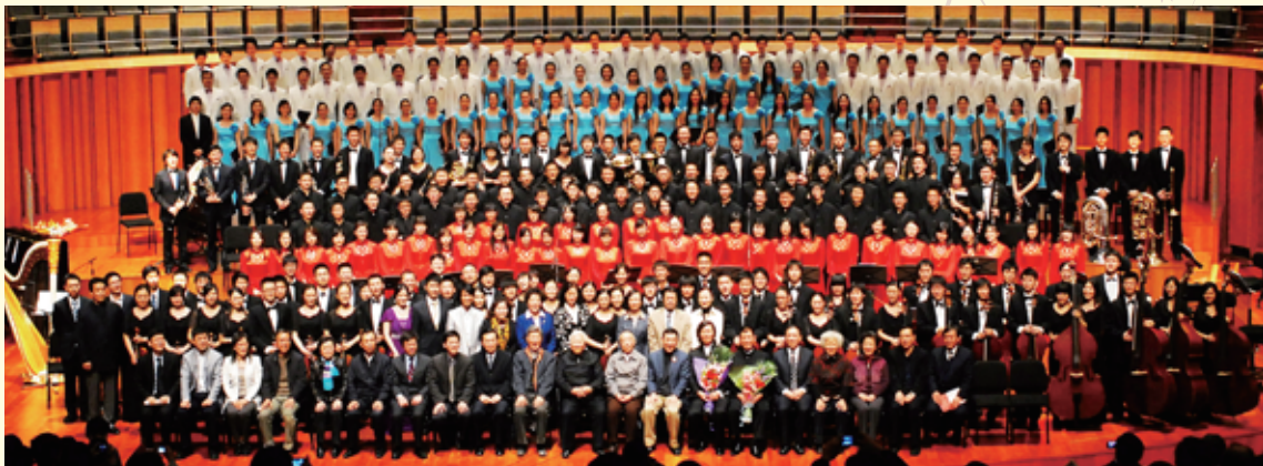
▲ 2011年4月，学生艺术团合唱队、交响乐队、民乐队、军乐队在国家大剧院举办“百年希望”专场音乐会