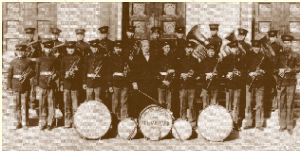
▲ 1934年，西乐部设在大礼堂前厅的二楼，军乐队在大礼堂前排练