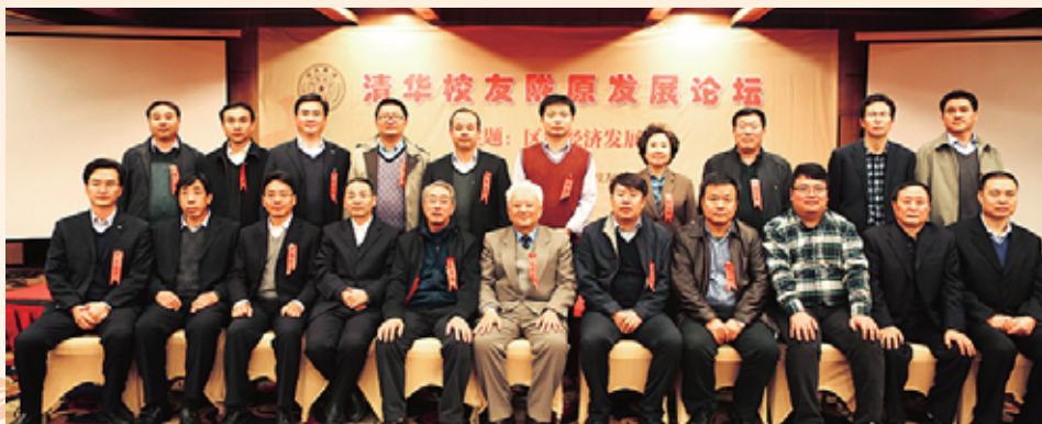
▶ 甘肃校友会举办“清华校友陇原发展论坛”