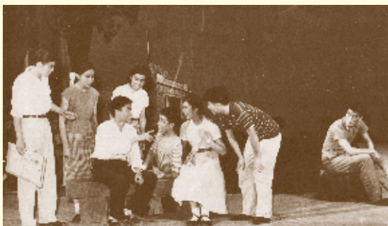
▲ 1959年，演出自创话剧《清华园的早晨》