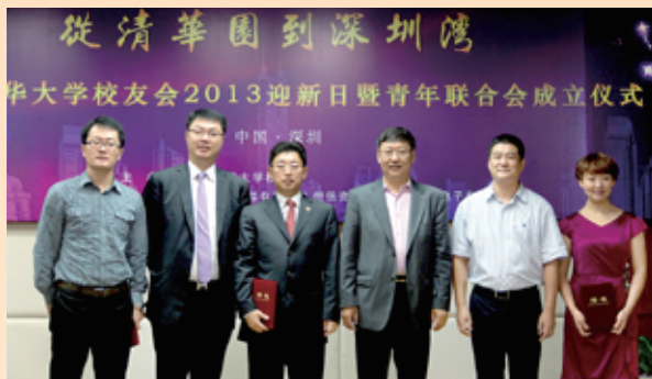
▲ 深圳校友会2013迎新日暨青年联合会成立仪式举行