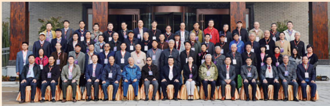
▲ 徐州校友会成立30周年庆典活动举行，参会校友合影留念