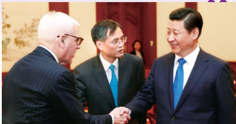
◀ 国家主席习近平在北京钓鱼台国宾馆会见清华大学经济管理学院顾问委员会海外委员