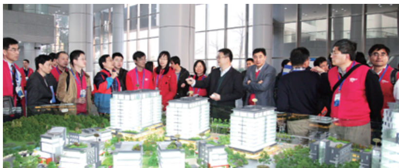
考察团参观力合（佛山）科技园