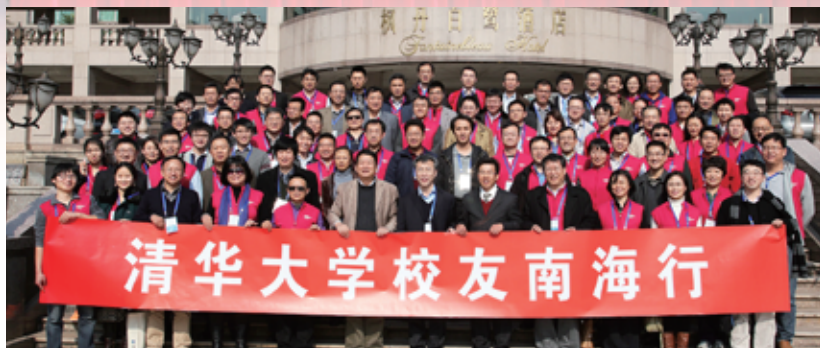
考察团在南海合影

此次考察活动旨在帮助海外校友了解国内的创业投资环境和各地的引智政策，为海外留学人才搭建回国创新创业的平台。考察城市包括深圳、惠州、东莞、佛山南海、佛山顺德等五地，之后部分校友参加了附加行程山东青岛的考察。