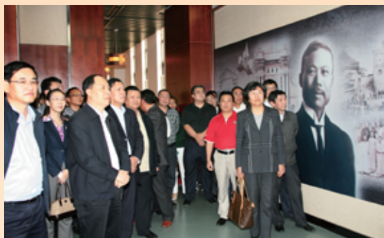
▲ 珠三角校友纪念清华首任校长唐国安逝世一百周年