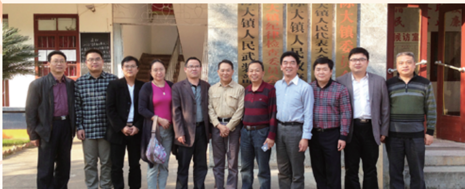
▲ 厦门校友会看望当地清华大学引才生，图为探访在三明乡镇工作的同学