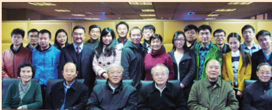
◀ 南京校友会举行2013年迎新座谈会