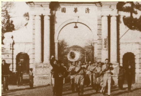
▲ 1948年，军乐队同学去海淀游行