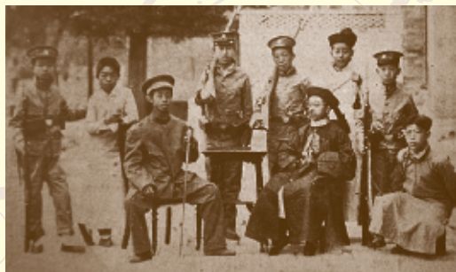
▲ 1913年，闻一多编导并表演《革命军》，是清华最早的戏剧活动之一