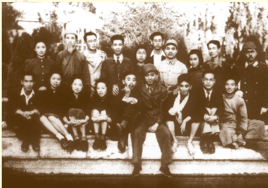
▶ 1946年4月，西南联大剧艺社在昆明龙云公馆演出话剧《凯旋》后合影