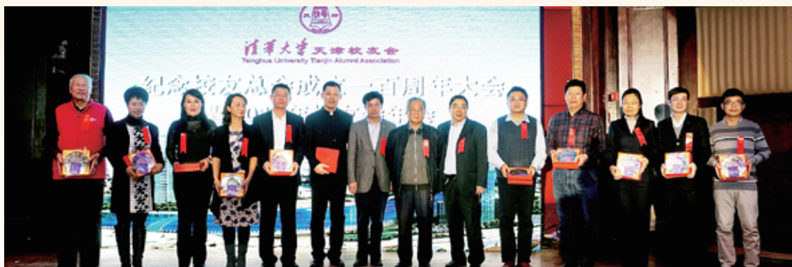
▲ 天津校友会纪念清华校友总会成立一百周年暨2013年年会隆重举行。图为获得“特别奉献奖”的12名校友上台领奖