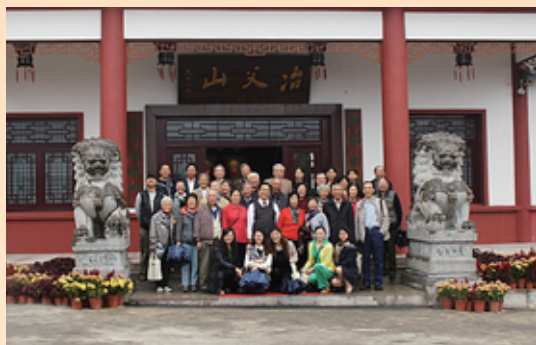
▲ 安徽校友会为60岁以上校友举办重阳敬老活动