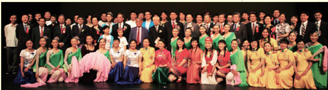
▲ 2005年，学生艺术团在香港理工大学演出结束后合影留念