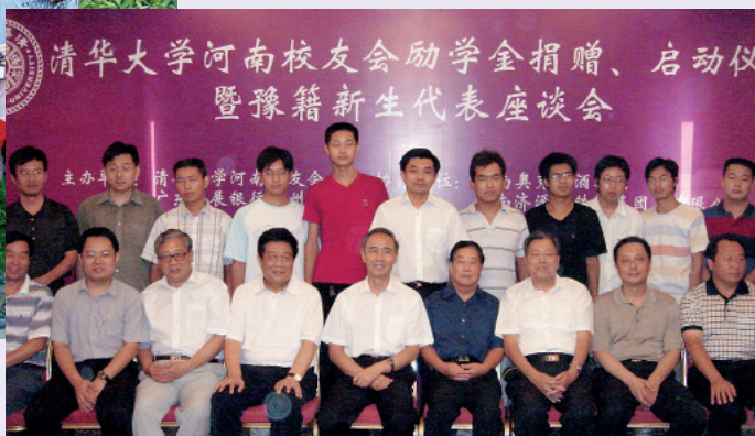
河南校友会捐赠励学金资助豫籍新生