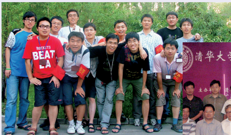
参加“爱心勤工、励学助困”活动的部分学生

校企与员工捐助在校学生。在清华控股有限公司的带领下，同方、紫光、诚志、威视、阳光、