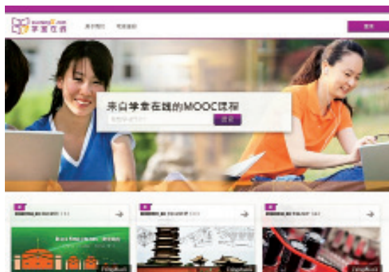
全球三大 MOOC 平台之一——学堂在线

集群以慕华教育投资有限公司为核心，依托清华大学在线教育研究中心，与哈佛、斯坦福、麻省理工、北大、复旦等国内外知名大学和国际货币基金组织、麦肯锡等知名机构合作，面向全球提供在线课程。所运营的学堂在线，是全球三大 MOOC 平台之一，是课程规模最大的平台，是学习者最多、最活跃的中文 MOOC 平台之一，上线课程超过 500 门，选课人数超过 300 万，用户分布全球近 130 个国家和地区，推出了财务分析与决策、心理学概论等一系列华语金牌课程。