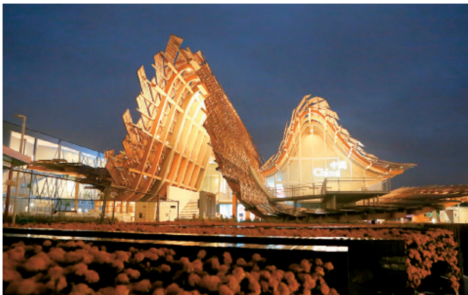
米兰世博会中国馆（清华美院和清尚装饰联合设计）

集群以清控人居控股集团有限公司、清华大学出版社有限公司、同方知网（北京）技术有限公司等为代表，涉及设计咨询、出版传媒和文化艺术等领域，推进文化创意与技术创新的深度融合。