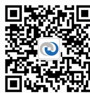
《清华产业》官方微信二维码