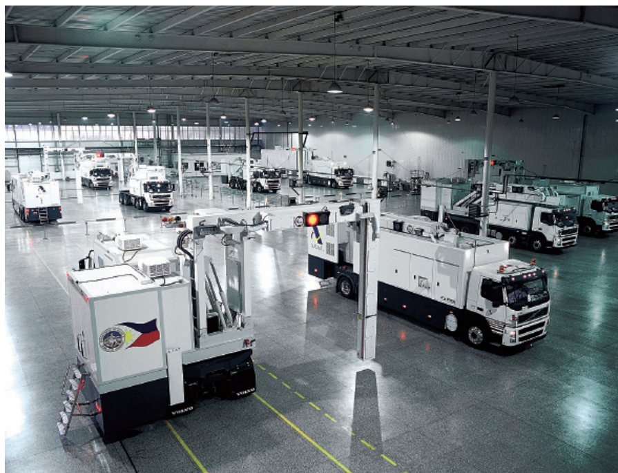
同方威视密云产学研基地

北京辰安科技股份有限公司：国家级应急平台的设计者与构建者，首创的应急平台综合应用