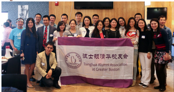
部分参会校友及志愿者

4月24日，波士顿清华校友会在奥斯顿区的一家日本餐馆举行了2016年年会暨105周年校庆午餐。250多位波士顿地区的清华校友和友人出席了本次年会。年会现场还安排了清华运动衫义卖，为清华助学金筹款。