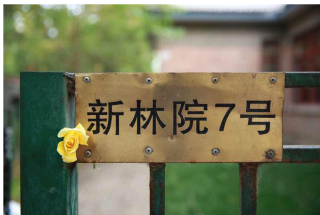
钱钟书、杨绛先生在清华的故居

这一夜，每个清华人都怀着无比沉痛的心情，以各种形式追忆着先生的温暖、温情和人间大爱。