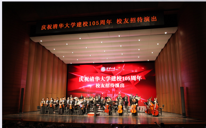
清华大学学生艺术团交响乐队演出