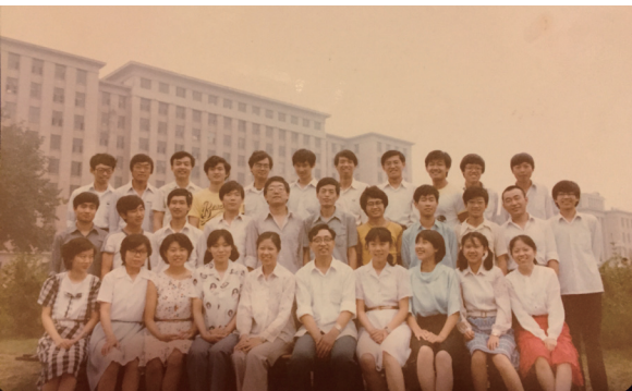
应化 12 班毕业合影