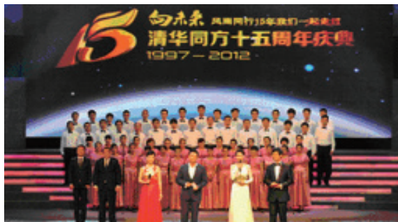
同方员工表演原创节目

6月27日，同方股份有限公司成立十五周年庆典大会在清华大学新清华学堂举行。庆典以“向未来——承担、探索、超越，风雨同行十五年”为主题，在回顾15年产业发展历史的同时，展示了科技成果产业化的探索之路，表达了清华同方人希望用自主技术实现“产业报国、服务社会”理想的拳拳之心。