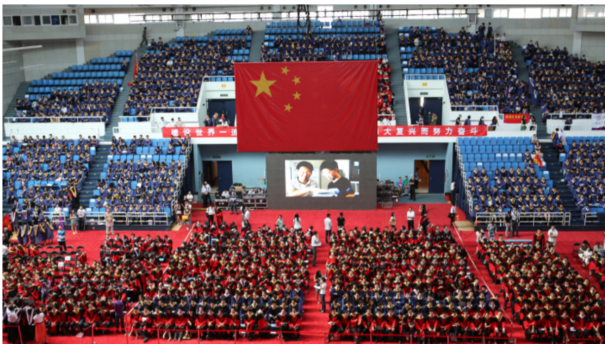
研究生毕业典礼现场