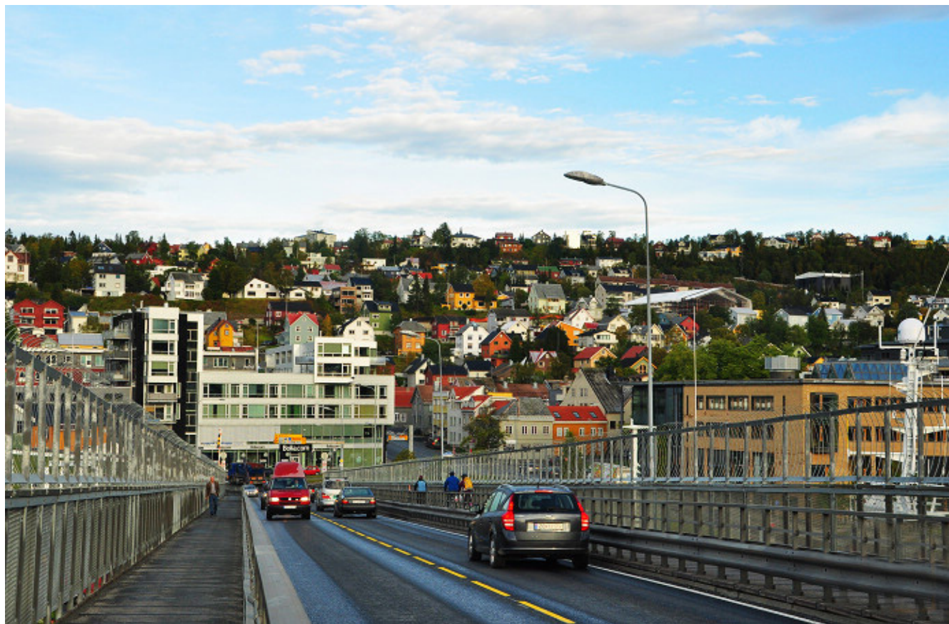
色彩斑斓的特罗姆瑟民居

最有意思的，当属最北的啤酒厂。他们生产的mack啤酒，堪称是世界最北的啤酒。在啤酒厂开的酒吧中，你只要在电脑上输入自己的名字，或者任何你想输入的亲朋好友的名字，就会得到一瓶印有名字的啤酒。这可是非常特别的礼物，