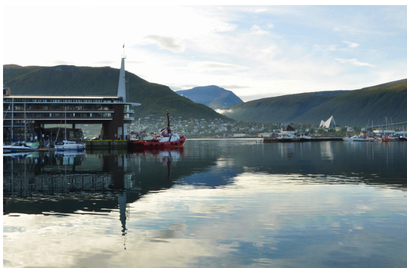
白色的北极大教堂，伫立在海湾边