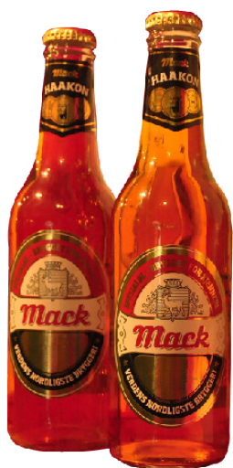
属于自己的独一无二的啤酒