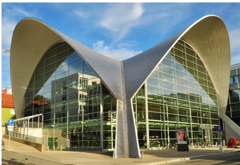
造型前卫的图书馆