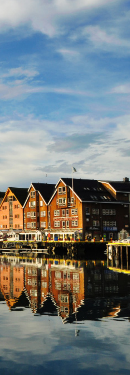
特罗姆瑟码头，安静的早晨