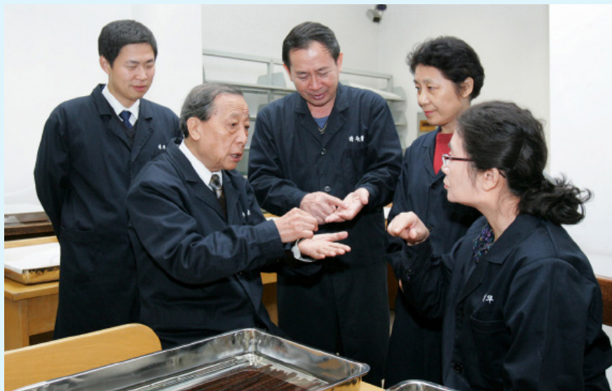
李学勤教授与研究团队

清华大学出土文献研究与保护中心成立于2008年8月，中心由清华大学历史系与图书馆、化学系等单位共建，由著名历史学家李学勤教授担任中心主任。中心的工作目标是通过开展自然科学与人文科学的交叉性合作，深入探讨出土文献整理、研究与保护工作的前沿课题，进而对中国古代文明做出创新性的研究，争取把本中心建设成为具有世界领先水平的出土文献研究和保护中心。当前中心的主要工作内容是对清华大学抢救入藏的战国竹简进行整理、研究与保护，同时开展甲骨文、青铜器等其他出土资料的研究和保护工作。