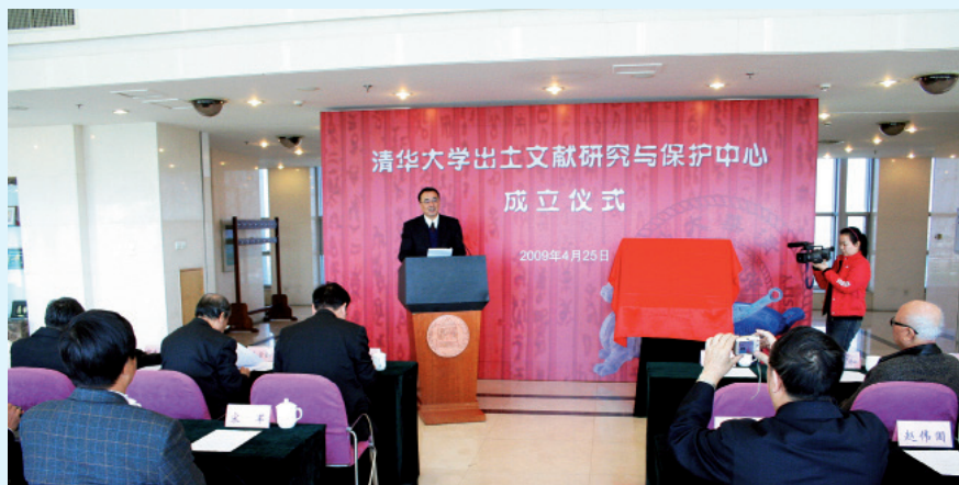
清华大学出土文献研究与保护中心成立仪式