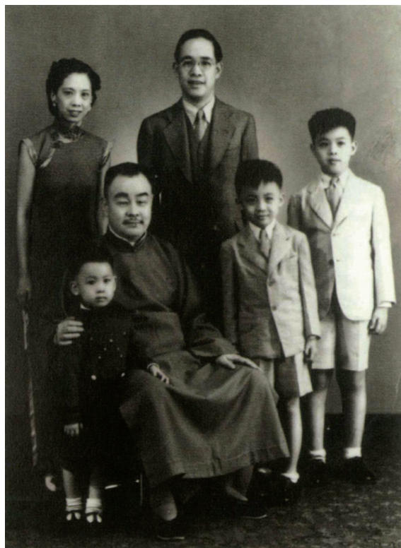
钱府祖孙三代（民国26年摄于上海）