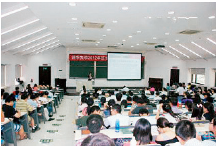
辅导员上岗培训现场

为了能将必备素质和能力的培训贯穿于辅导员工作的始终，学校注重将形势报告、哲学、经济学、教育学等经典理论的学习