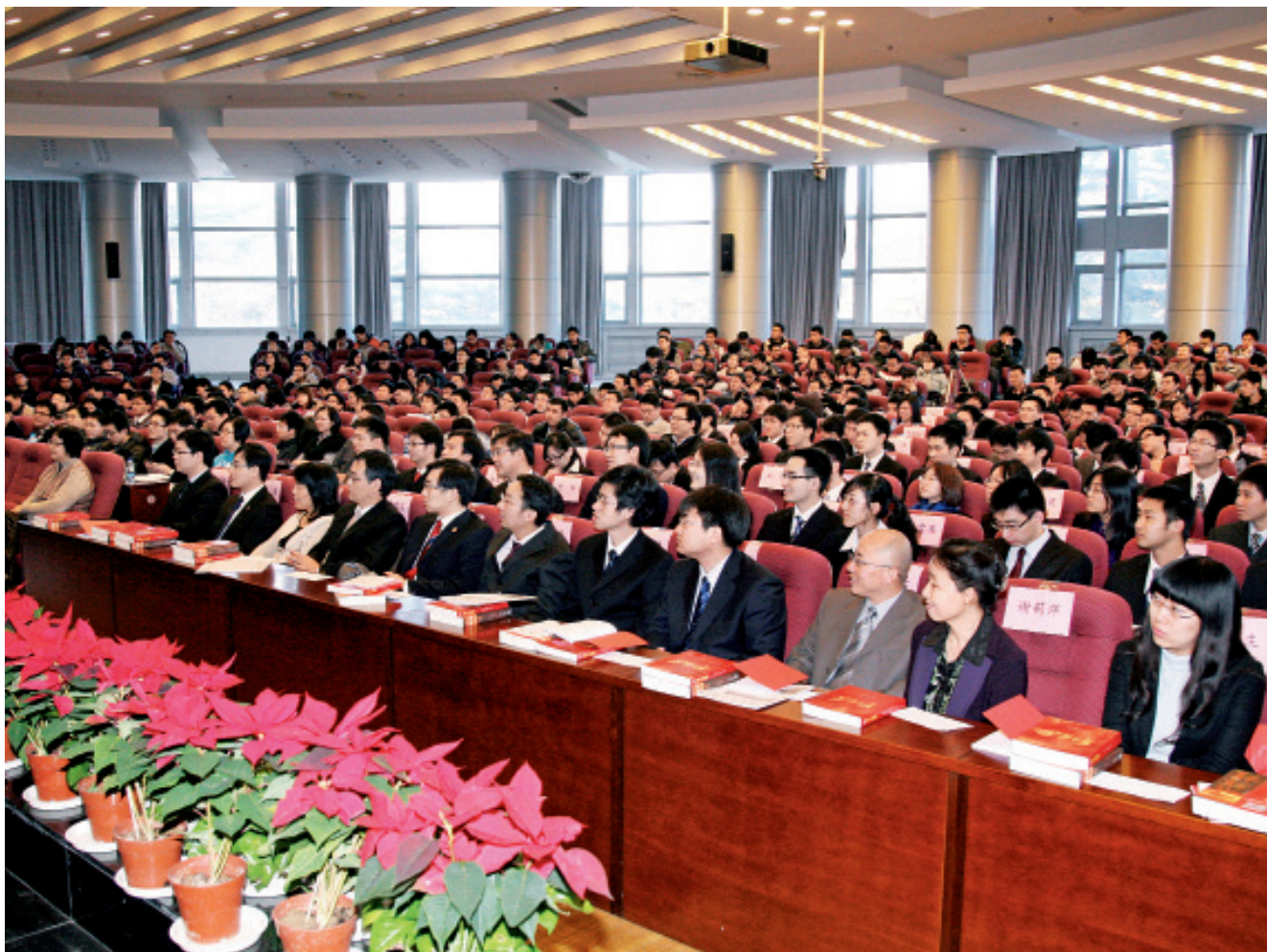
2011年优秀辅导员表彰大会现场