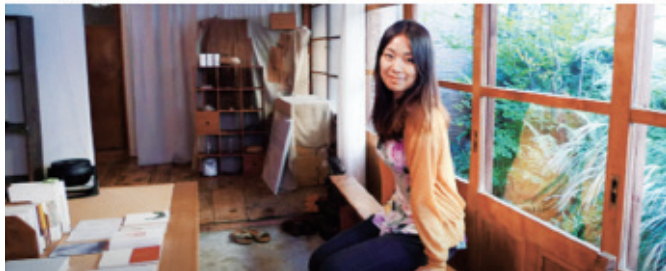
辅导员进行海外研修