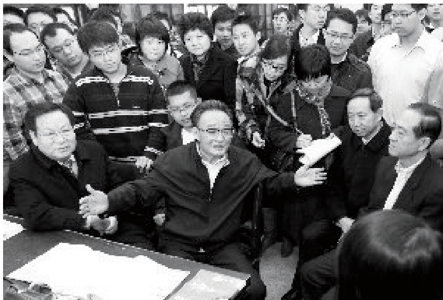
吴邦国 1960 年考入清华大学无线电电子学系，1964 年入党并担任政治辅导员，他说：“做辅导员不吃亏，是一种很好的锻炼。”

大多数干部在学生期间都曾经担任过学生辅导员，这个锻炼经历使得他们在走向校系党政管理工作岗位的时候，也始终不脱离业务工作。辅导员期间的政治锻炼使他们能始终坚持正确的办学方向，有较高的思想素养和管理水平，善于团结广大教职工为完成教学和科研任务而努力工作；辅导员期间的业务锻炼使他们始终没有脱离业务工作，掌握教育科研工作开展的基本规律。“双肩挑”的传统，使得学校在干部队伍建设中，可以实现“党政互换，校系交流”，模糊了“处长”和“教授”之间的界限，减少了干部的后顾之忧，也是学校始终保持稳定，上下协调，团结一致的重要因素。