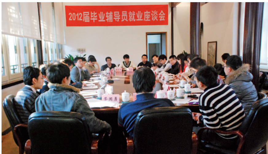
2012届毕业辅导员就业座谈会

导员开展研究工作?每年学校学生工作指导委员会都会发布“清华大学学生工作研究项目年度项目指南”,拨出专门经费,针对学生工作中的一些重点难点问题和有较高实用价值的研究课题,发布、资助学校和院系辅导员、班主任开展课题研究,一般每年支持30多项。同时学校还资助辅导员论文发表经费,支持辅导员专著或合著著作的出版工作。就是在这些研究成果的基础上,学校的德育研究工作取得了长足的进步,多项成果荣获北京市高校党建与思想政治工作一等奖,还有多名辅导员荣获校内的优秀教学成果特等奖或一等奖。