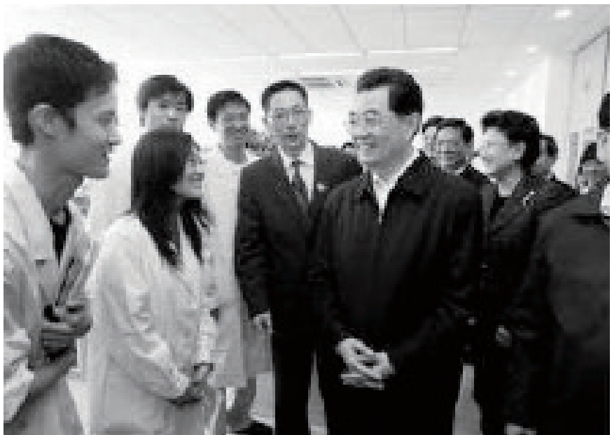
胡锦涛 1959年考入清华大学水利工程系，1964年入党并担任政治辅导员，为此他将毕业时间推迟到1967年。

在清华，学校和院系领导亲自为辅导员讲课、开小灶，为辅导员制定专门的培养计划，把辅导员工作作为一门特殊的课程，将学习和工作有机结合起来。学校始终坚持将使用和培养有机结合起来，逐人落实，这正是因材施教教育思想的一种生动实践。也正是这种因材施教的培养途径，使得“双肩挑”的政治辅导员队伍中走出一批又一批杰出的人才，在共和国的历史上留下了一串串闪亮的名字。