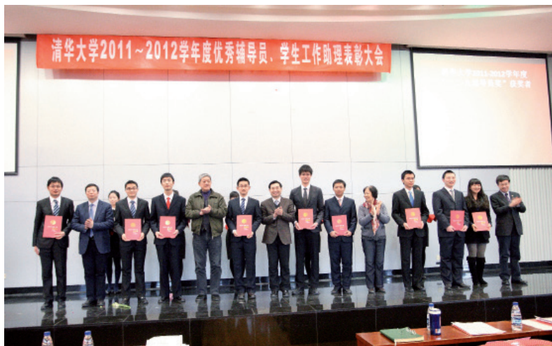
清华大学2011~2012学年度优秀辅导员、学生工作助理表彰大会

有人打过一个比方，说培养辅导员就像种庄稼，学校并没有仅仅在秋天去等待收割，而是在春天就开始积极播种，将辅导员的培养与学生党建工作、社会工作岗位锻炼等培养环节紧密结合起来，从低年级开始注意选拔一些基本素质好、业务能力强的学