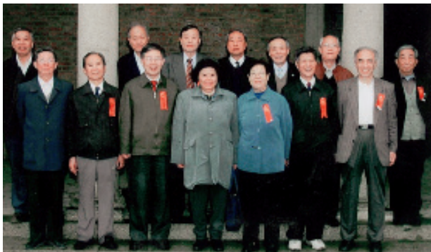
部分首批政治辅导员合影

1953年4月3日，清华大学向高教部、人事部请示设立学生政治辅导员。报告写道：“为了加强对学生的思想政治教育，保证学习任务的完成，并减少学生中党团员的社会工作至政务院规定的每周六小时的限度，我们拟根据1952年政务院批准的全国工学院院长会议决议设立政治辅导员制度。办法是：拟选学习成绩优良，觉悟较高的党团员担任辅导员，其学习年限延长一年，学课则相应减少，每周进行二十四小时工作，这样，并可培养辅导员成为比一般学生具有更高政治质量及业务水平的干部。”