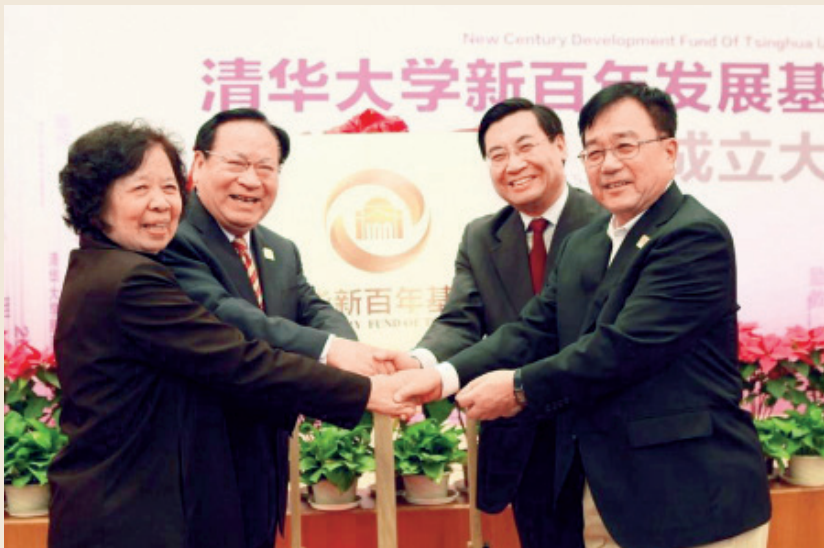
清华大学新百年发展基金成立仪式

清华大学新百年发展基金由清华大学教育基金会、清华校友总会和308名校友、清华之友及组织于清华大学百年华诞之际发起成立，定名为“清华大学新百年发展基金”（英文名称：New Century Development Fund Of Tsinghua University）。该基金为留本基金，委托清华大学教育基金会进行独立统一封闭管理，负责基金资产的保值和增值。旨在支持清华大学在新的一百年中全方位持续发展，早日跻身世界一流大学前列。新百年发