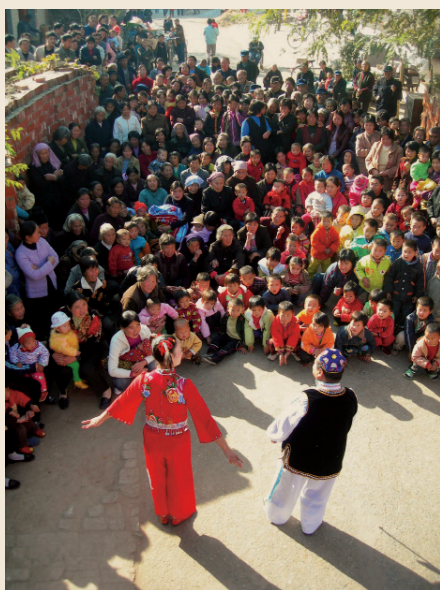
文楼村文艺剧团和感谢信

一个半月后，清华新百年基金秘书处收到了一封手写函件，这是文楼村剧团的全体成员集体签名的