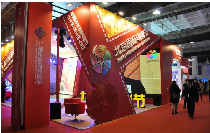
2012年12月，第七届国际文化创意产业博览会在京举行

第四，围绕人才、市场、企业的核心元素，政府有所为有所不为的政策执行合理到位。英国政府在推动文化创意产业发展的同时并不介入产品生产、不干预市场、不影响微观的企业活动，而是集中在人才培养、市场体系、企业创新等方面提供开发技术和教