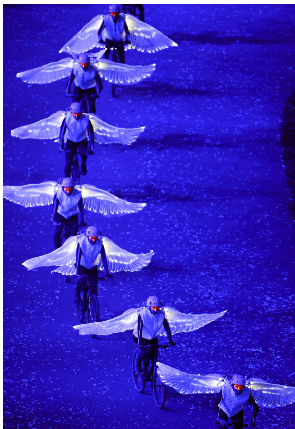
伦敦奥运会开幕式也是英国文化创意产业发展的一个缩影

潜力大，高原创性或高创新性作为标准来定义文化创意产业，不是简单地发展所谓传统的文化产业，而是将文化创意扩展到整个经济领域，鼓励工业产品和商业服务的文化创意创新，推动经济发展转型，涵盖了软件开发、出版、广告、电影、电视、广播、设计、视觉艺术、工艺制造、博物馆、音乐、流行行业以及表演艺术等十三项产业，不仅扩大了产业范