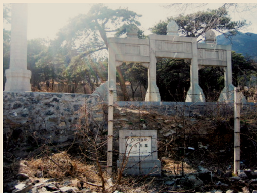
京郊门头沟周自齐墓。 此图中左侧华表今已看不到，据说已被相关部门收藏

周自齐修建了北京第一条水泥马路——东总布胡同；任交通部总长时，他支持邮政总办加入万国邮政联盟，标志着中国成为邮政主权国家；任农商部总长时，他倡导以每年清明节为“植树节”。他成立了孔雀电影公司，计划经营发行外国的影片，并拍摄中国的电影。他请人译制了《莲花女》，是外国影片配上中文字幕的开端。同时留下他自己1923年葬礼大典的记录——从东总布胡同出发，场面巨大，有庞大的出殡队伍，队伍中既有中国特色的和尚、道士、喇嘛，也有西洋味十足的军乐团。经过前门的镜头还可以看到边上卖东西的。沿途人的穿着打扮都被记录下来，一直到他下葬门头沟。有人评说那是最早记录中国风土人情的片子。如今周自齐的墓地周家坟，已经成为门头沟文物保护单位。