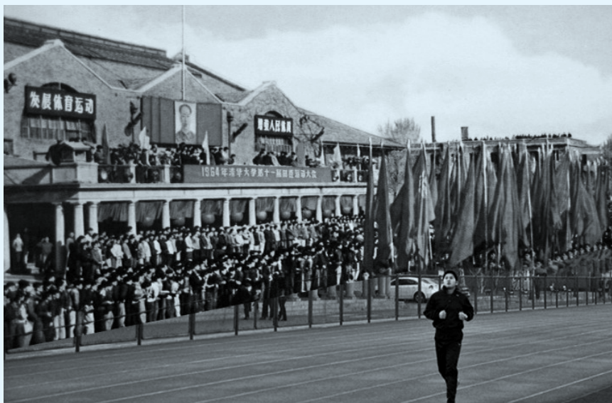
西大操场