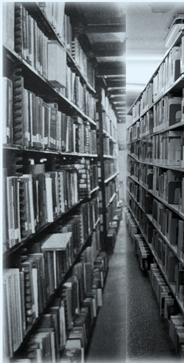
老馆书架