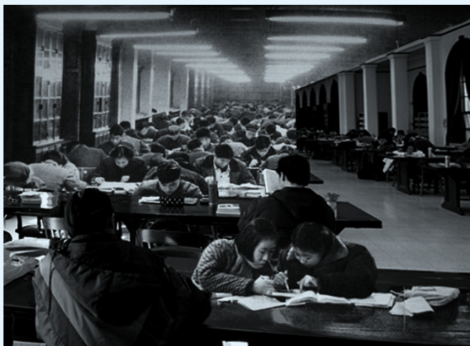
老馆阅览室