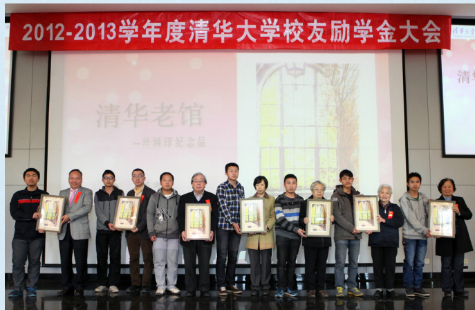
2012—2013年度校友励学金大会

都需要从零开始一点点建立。从前期的宣传、策划，到与校友达成捐赠意向、签订协议、资金到账，再到和受助同学之间的互动，包括资金发放到学生手上之后的评定、座谈等各个环节，这一系列的后期服务都是非常复杂的，需要认真细致地去做。