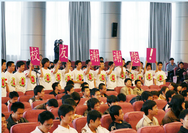
受助学生代表在励学金大会上打出标语感谢校友