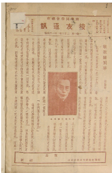
1934年1月1日，清华同学会总会《校友通讯》创刊号

1948年12月，清华园解放。1949年4月24日《清华校友通讯》(解放后第一期)出版，刊登校务会议临时主席冯友兰的文章“解放期中之清华”。1950年4月29日“解放后第二期”出版，刊登校务委员会主席叶