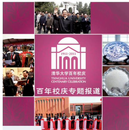
《清舞飞洋》2011年5月总第二十二期