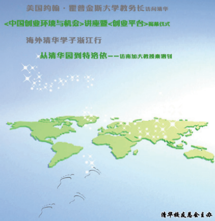
《清舞飞洋》2010年1月总第十期