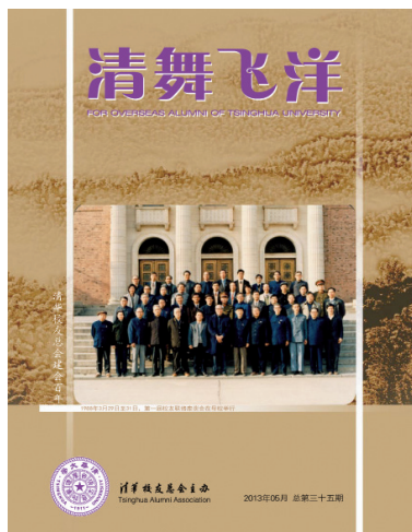
《清舞飞洋》2013年5月总第三十五期