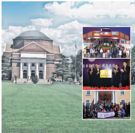
《清舞飞洋》2009第1期创刊号