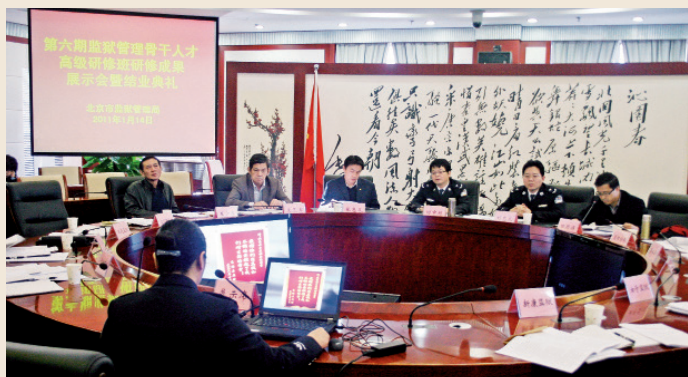
2011年1月，北京市监狱管理局第6期骨干人才培训班结业论文答辩会场

志存高远方能海纳百川，追求卓越方能硕果累累。为了保证司法培训质量，学院司法中心从培训内容、培训师资、教学模式以及考核标准方面进行了一系列品牌创新尝试。