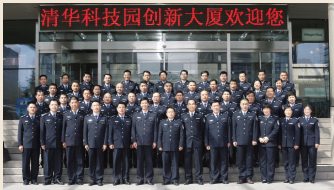
2013年4月，广西壮族自治区监狱管理局处级以上干部来清华培训开学合影

一分耕耘一分收获。学院司法中心的培训课程，使参训学员收到了立竿见影的效果。2010年5月，成都市青羊分局学员在学院参加培训后回到工作岗位不到一周时间，所辖市区连续发生了三起群体性突发事件，担任事件处置小组组长的学员按照培训中所学的“突发事件处置方法”和“新闻媒体应对”课程内容，有条不紊地按步骤谈判、化解冲突并立即召开新闻发布会向媒体释疑事件始终，让群众满意接受、使媒体称赞叫好并获得了市委表彰。学员高兴得连夜打电话向学院汇报其成绩并感谢学院的培养。2011年，新