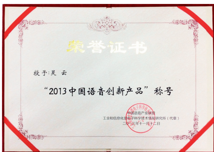
捷通华声灵云获奖证书

11月12日，捷通华声携灵云参加了在北京举行的中国语音产业年会，会上由工信部领导代表中国语音产业联盟授予捷通华声灵云“中国语音创新产品”称号。