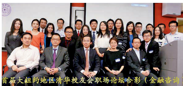
首届大纽约地区清华校友会职场论坛合影（金融咨询） 与会人员合影

此次活动旨在传递大纽约区清华校友在金融和咨询行业的影响力，并通过这个平台帮助年轻校友更好更快成长。