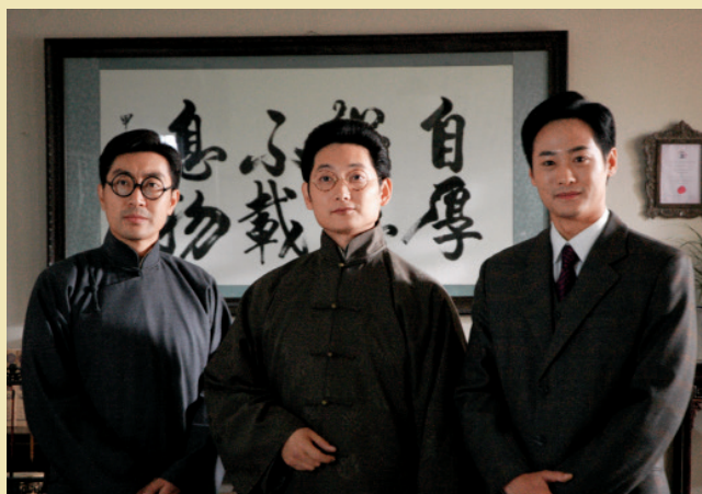
剧中人物（右起）：冯友兰、梅贻琦、叶企孙