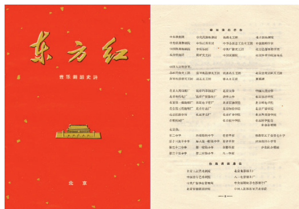
《东方红》演出邀请函