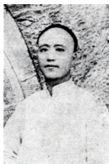
30年代中乐部导师 爱新觉罗·溥侗