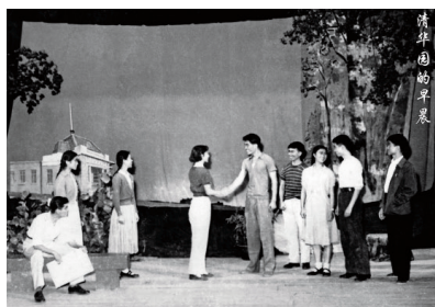
1959年话剧队演出自创话剧《清华园的早晨》