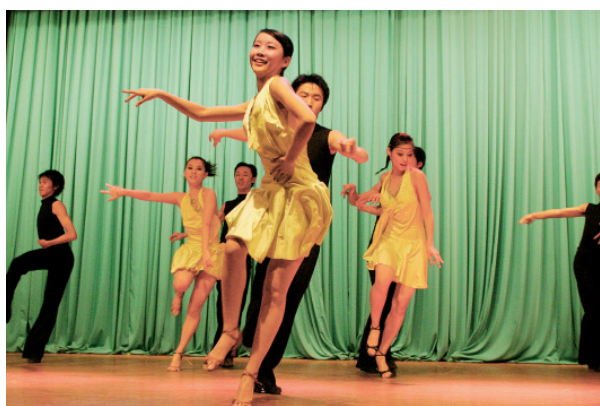
国标队拉丁集体舞