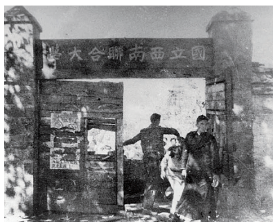
西南联合大学剧艺社演出