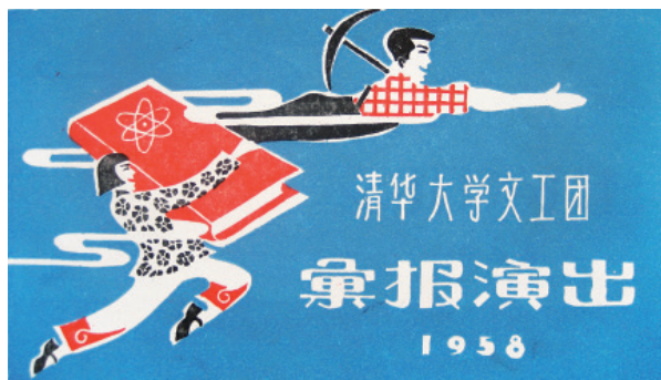
1958年12月清华文工团天桥剧场演出请柬