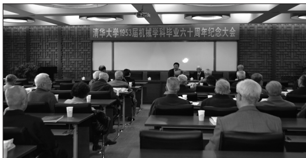
1953届机械学科毕业60周年纪念大会会场

尽管如此特殊，我们这一群校友却都具有同一时代赋予的鲜明共性。我们都在中学阶段经历过日寇侵华和国民党统治时期的深重苦难，非常渴望祖国富强、民族振兴，都对建设社会主义新中国满腔热情，都愿意为国家利益不计个人得失。只要是祖国需要，无论是参军参干，还是提前任教，我们都义无反顾。参与毕业分配的同学，无论是分派到学校当教师、做研究生，还是到一汽、北钢等国家重点企业和工厂设计院去工作，或是到中等专科学校、一般企业去工作，没有人讲条件、提要求，