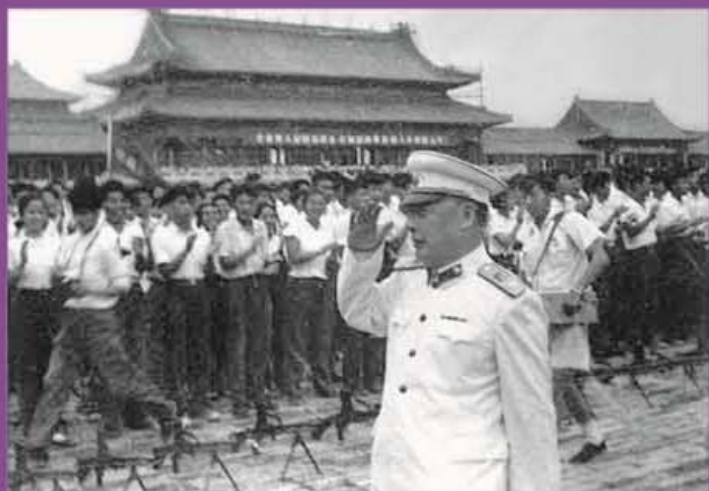
陈毅元帅检阅清华民兵师