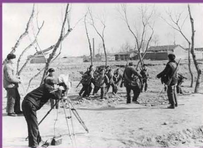
八一电影制片厂在拍摄清华民兵训练