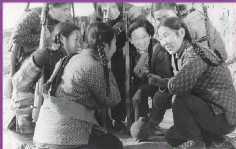
清华女民兵训练“埋雷”