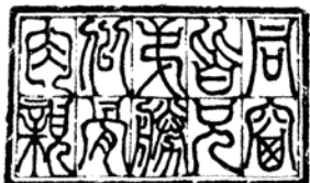
同窗皆兄弟 胜似骨肉亲