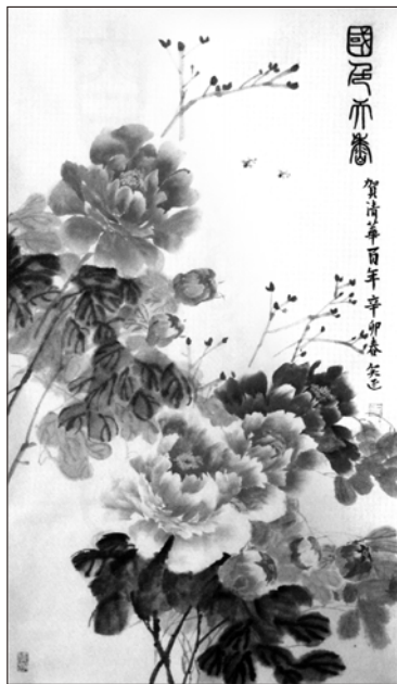
国画 国色天香 王笑延 (一九六八自控)