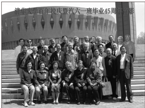
我们班又团聚了。新清华学堂前，2011年4月24日