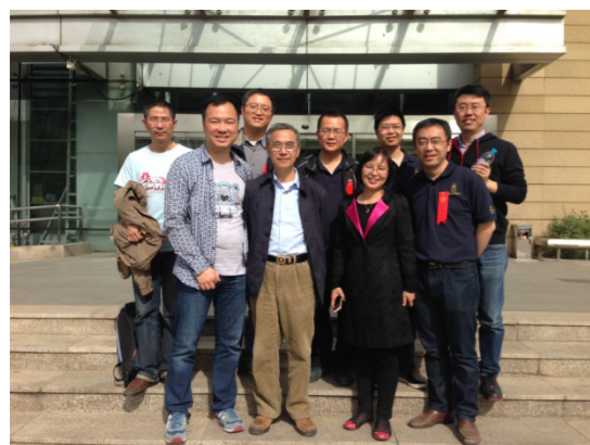
再忆往昔 | The Tsinghua People

最温馨: 毕业二十年, 绝大多数同学都已成家立业, 很多是带着清二代们一起来参加校庆活