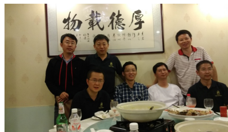
再忆往昔 | The Tsinghua People