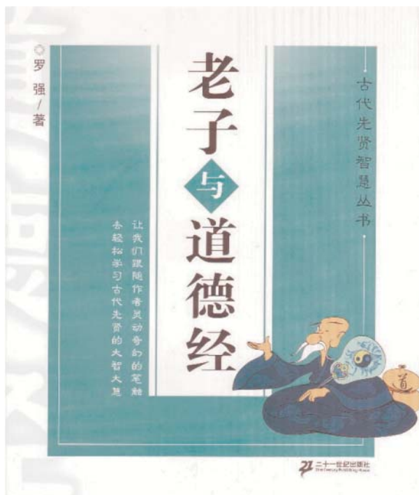
罗强著《老子与〈道德经〉》一书的封面