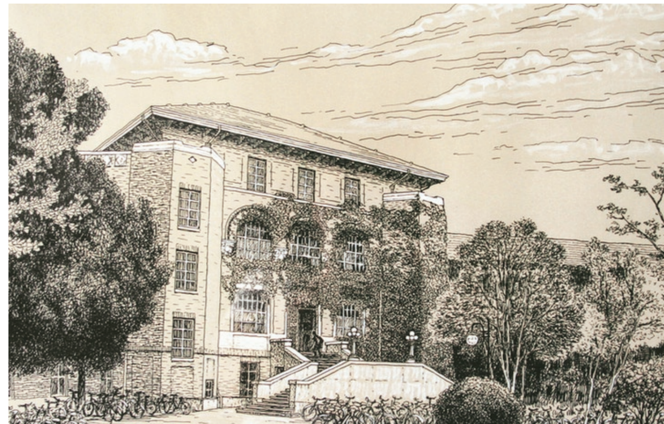
图书馆 / 体育馆