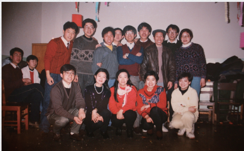
The Last Christmas