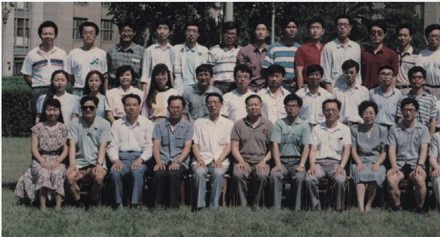
无 81 毕业合影

“二宝”，精力旺盛，体格强健，并把它投入到学习之中。二宝同学很健谈，性格开朗，时常咯咯笑着，但参与课外娱乐活动不多。