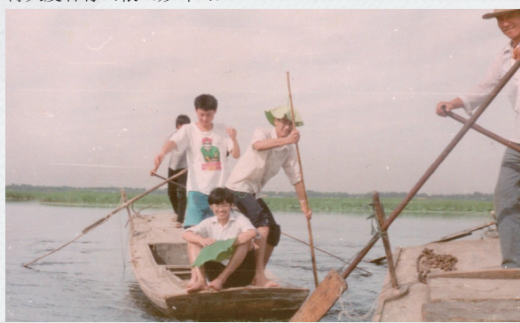
碧淀涵秋水鉴湖（白洋淀）