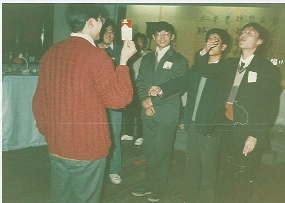
云山雾罩——烟枪队（北京的雾霭，俺们来了！）