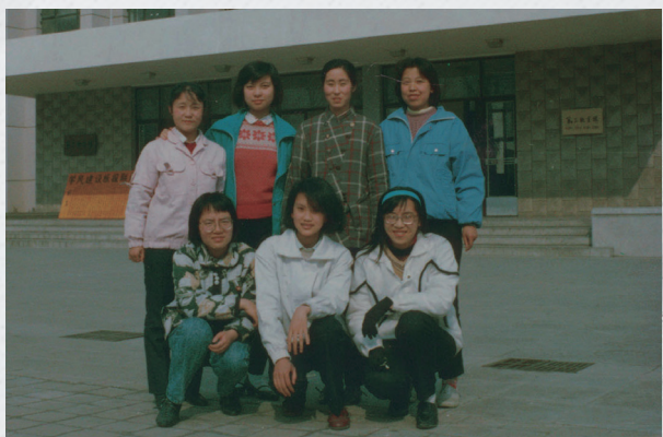
这是七朵金花全家福，数量质量都冠绝校园