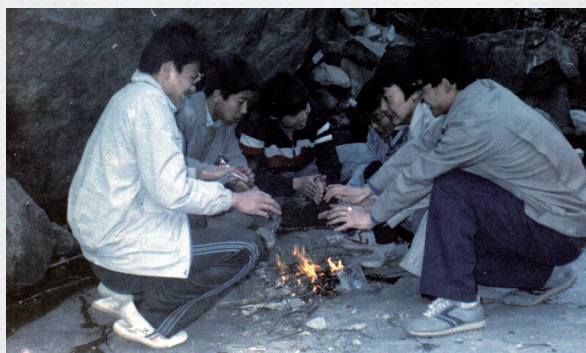
篝火度谷行山根（妙峰山）