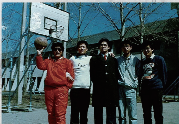
木关系，男子汉大豆腐岂患无妻？俺们有高大威猛——篮球队