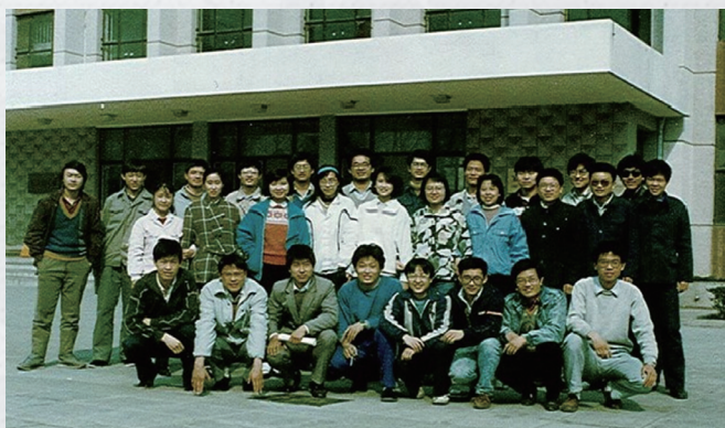
青葱不？那是 88 年大一