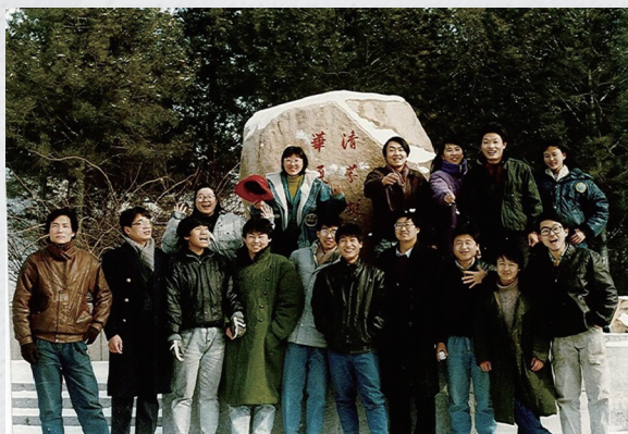
答案是：缺女生！美多了吧？笑得多开心哪