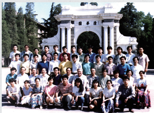
毕业！5 年的变化主要在服装吧？顺祝老师们健康！