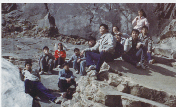
冰川脚下做神仙（天仙瀑）