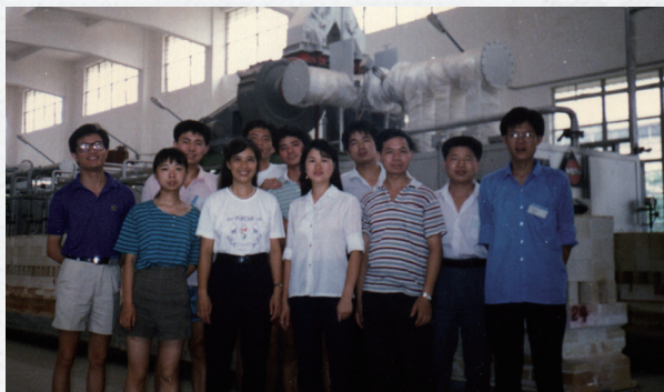
还实习，为后来走上黑涩会