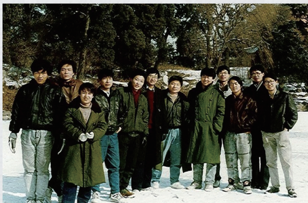
这是咱清华最大特色，看出缺什么