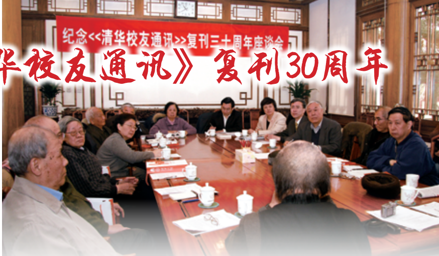
3月20日，“纪念《清华校友通讯》复刊三十周年座谈会”在工字厅举行