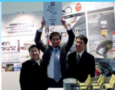
2004年，汽车系师生在德国国际汽车设计竞赛中获“最佳内饰设计大奖”