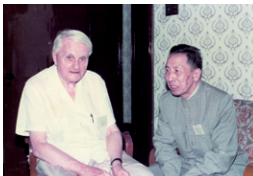
1984年8月，夏鼐出席第三届国际中国科技史研讨会，与英国著名中国科技史专家李约瑟交谈