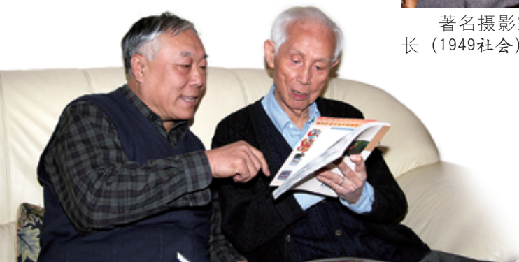
孙哲（左）与著名应用数学家林家翘学长（1937物理）