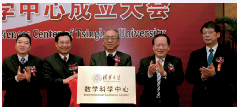
清华大学数学科学中心成立，国际数学界最高荣誉菲尔兹奖获得者、美国科学院院士丘成桐先生（中）担任中心主任