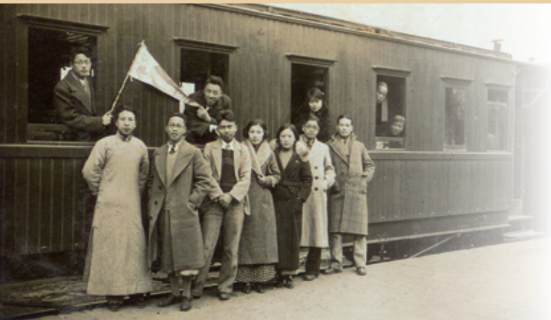
1934年4月，夏鼐（前左1）与清华同学赴山西大同游览途经石家庄车站留影

夏鼐（1910.2.7—1985.6.19），浙江温州人。1934年毕业于清华大学历史系。中国现代考古学的奠基人之一。