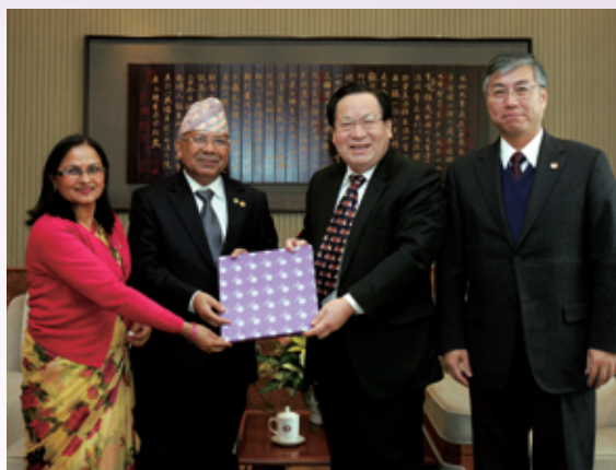
尼泊尔总理尼帕尔访问清华，并做客清华海外名师讲堂