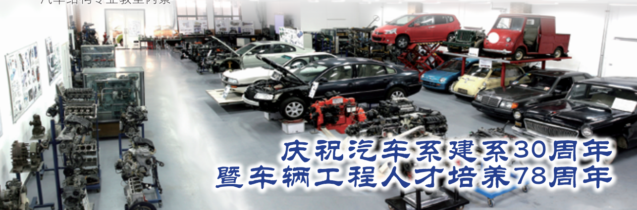
汽车结构专业教室内景