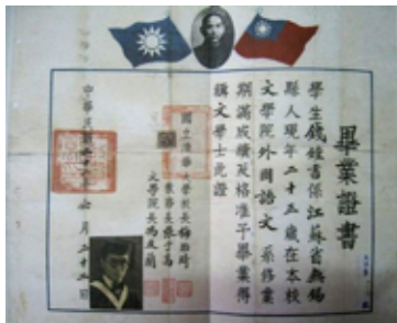
钱钟书先生的清华毕业证书（1933年）