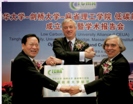
为发展低碳能源、应对气候变化，清华大学-剑桥大学-麻省理工学院低碳能源大学联盟成立