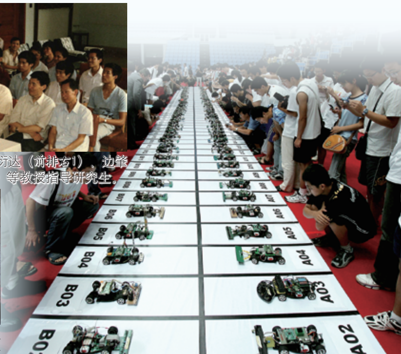
2006年8月，承办首届全国智能车大赛