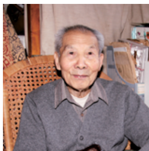
著名摄影家张祖道学长（1949社会）