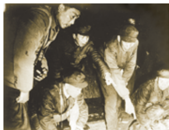
1974年，夏鼐（左2）在马王堆3号汉墓发掘现场

夏鼐（1910.2.7—1985.6.19），浙江温州人。1934年毕业于清华大学历史系。中国现代考古学的奠基人之一。