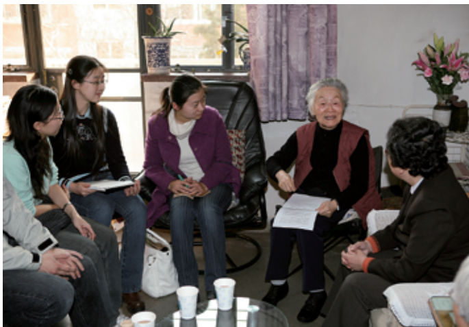
2001年9月，杨绛先生将他们夫妇的稿酬72万元及其后出版作品版税全部捐赠清华，设立“好读书”奖学金。至2009年底，该基金已达815万元。图为2007年12月8日，杨绛先生和“好读书”奖学金部分获奖同学交流