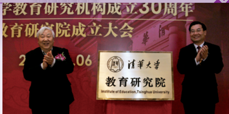
清华大学教育研究院成立，党委书记胡和平与中国高教学会会长周远清共同为研究院揭牌