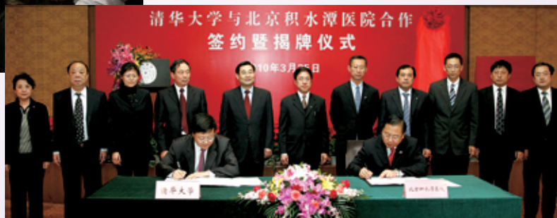
清华大学与北京积水潭医院合作成立清华大学积水潭骨科学院，北京积水潭医院同时成为清华大学临床教学医院