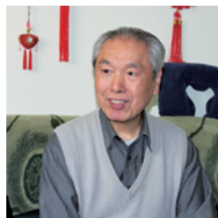
原机械电子工业部副部长唐仲文学长（1952机械）