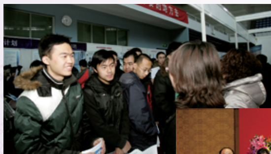
2010年度清华大学规模最大的校园招聘，吸引了来自清华及周边高校毕业生上万人参加