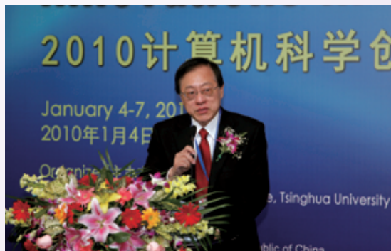
清华大学理论计算机科学研究中心 (ITCS) 举办2010计算机科学创新研讨会，中心主任姚期智先生致辞