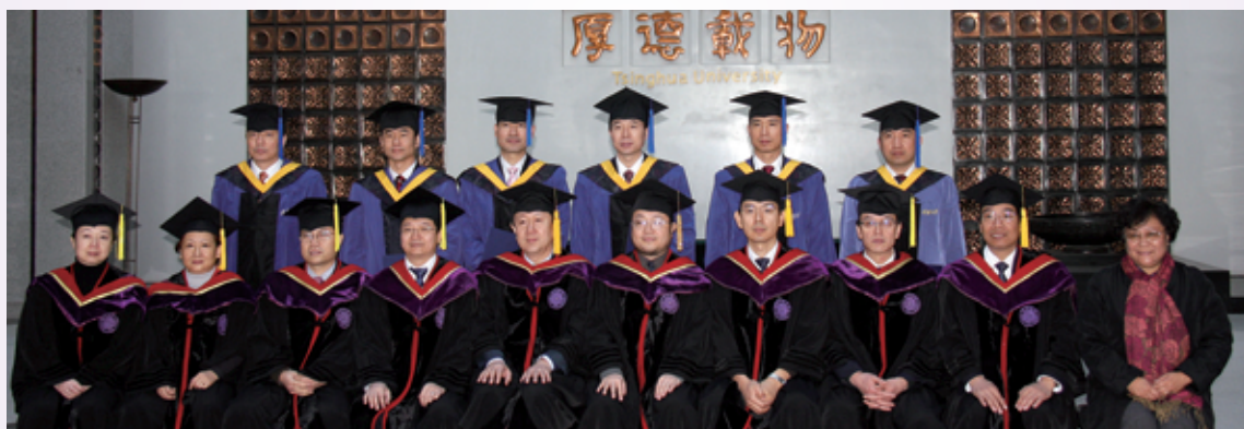
13名航天员获得清华大学航天工程领域硕士学位。图为部分航天员与老师合影，后排左起李庆龙、刘伯明、翟志刚、景海鹏、费俊龙、吴杰