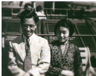
1935年8月，新婚的钱钟书、杨绛夫妇在赴英留学的邮轮上