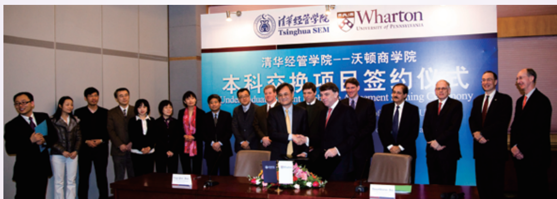
清华大学经济管理学院与美国宾夕法尼亚大学沃顿商学院本科交换合作协议签署