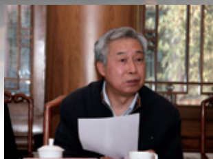
中国科学院院士欧阳 忠灿学长（1968自控）发言