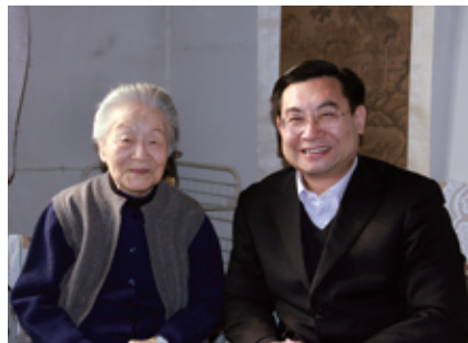
2010年新春，学校党委书记胡和平看望杨绛先生