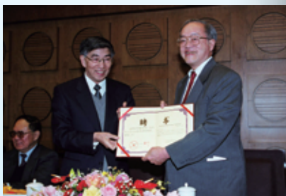
2001年，王大中校长向美国工程院院士、哈佛大学教授何毓琦先生颁发自动化系讲习教授聘书