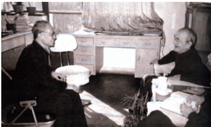
“文革”后，钱钟书与他的清华同学胡乔木在三里河新居