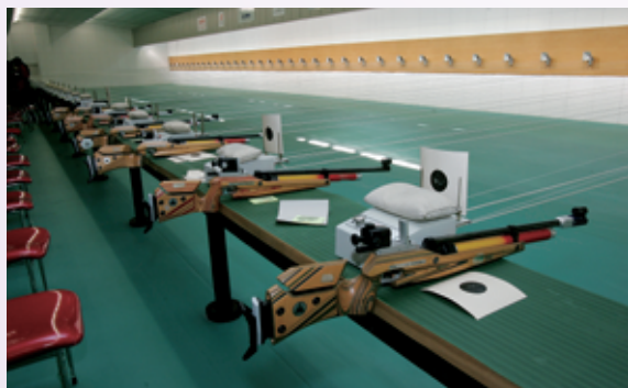
清华大学新射击馆“维学馆”落成启用