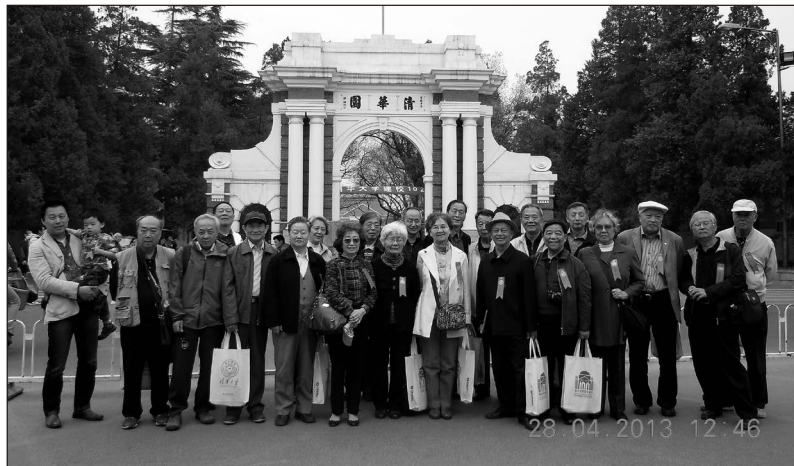
建三毕业 50 周年时在二校门合影

多少可歌可泣的事迹，并未为常人所知。对我们这代人的评价，还是让历史作结论吧！我们的专业成就迟早会被超越，但我们的奋斗精神将成为永恒。